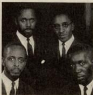
The Modern Jazz Quartet

skyldes utelukkende tilfeldigheter, men likevel kan det vel tenkes at begge plater får en ekstra publisitet i forbindelse med oppløsningen av MJQ.