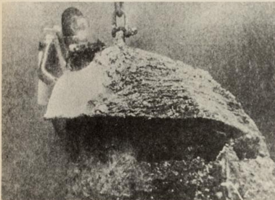
En av froskemannsteamet undersøker den sunkne ubåten X-5 i Altafjorden.