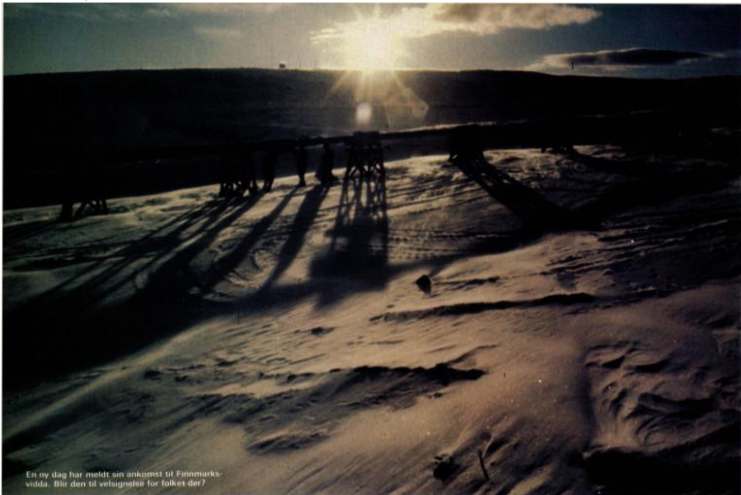
En ny dag har meldt sin ankomst til Finnmarksvidda. Blir den til velsignelse for folket der?