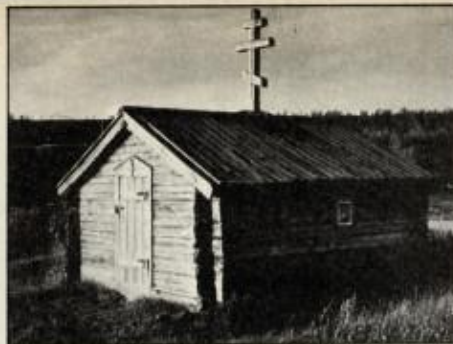
St. Georgs-kapellet i Neiden ser ut som et vanlig stabbur. I virkeligheten er det et minnesmerke over den hellige Trifon.

Og neste morgen, da de tre våknet ved daggry, så ikke den gamle professor at de unges lepper var fuktige av kjærlighetens første dugg.