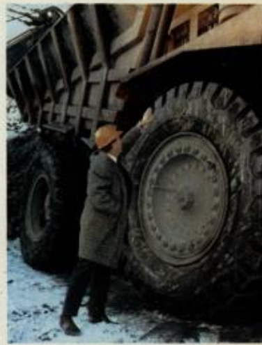
Det er dimensjoner over truckene. Hvert dekk koster vel 20 000 kr.

Men friheten ble feiret, også der. Og ikke alltid på det mest stillferdige vis. Tyskerne hadde etterlatt seg et anselig brennevinslager i en sidetunnel. Noen karer hadde funnet fram dit, russiske kamerater fikk bli med. O jubel! O forferdelse! De sultne og slitne soldatene, hulefolkets befriere, ble ganske fort rebelske av denne uventede adgang til nesten ubegrenset kvantum ildvann. Hujende, ropende, truende ravet de