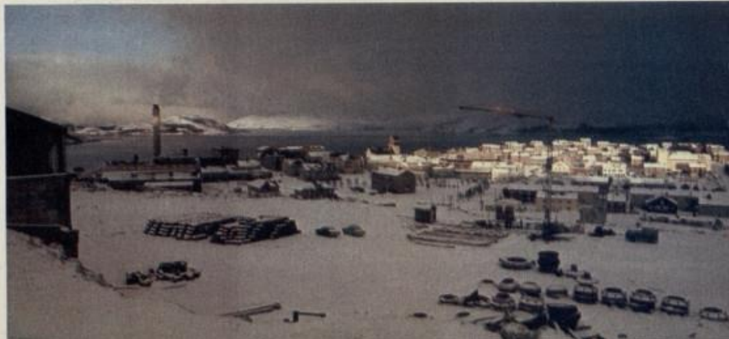
Kirkenes sett fra A/S Sydvarangers anlegg.