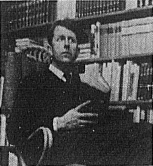
Kåre Holt - om Kong Sverre

Kåre Holts store, innlevende og dypt engasjerende tre-bind roman om birkebeinerkongen Sverre er nå fullført i Gyldendals Lanterne-serie. Siste bind, «Hersker og trell», er kommet i disse dager.